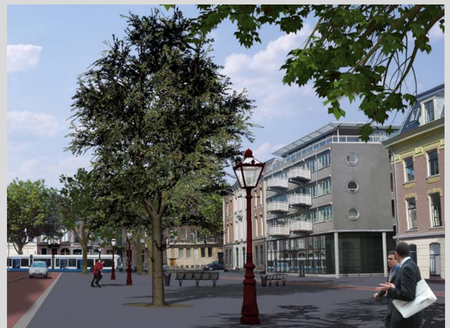
Variant met behoud gevel

Een probleem bij het realiseren van een ondergrondse garage vormt de bestaande kantooruitbouw van Professor Tulpplein 3. CASA architecten is gevraagd om in een haalbaarheidsonderzoek de mogelijkheden te onderzoeken voor het verwijderen van deze uitbouw.