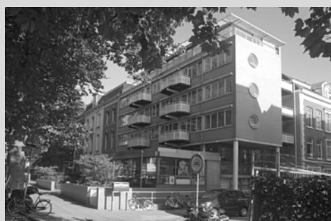
Bestaande situatie met uitbouw