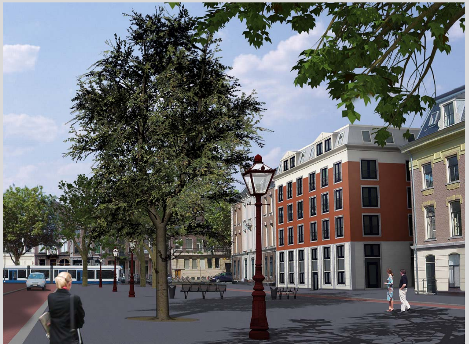
Variant met aangepaste gevel

Het Stadsdeel Centrum, het Amstelhotel en Theater Carré zouden graag een parkeergarage onder het Professor Tulpplein gerealiseerd zien. De parkeerdruk op straat is momenteel groot, vooral bij voorstellingen in Carré. Bovendien is de belevingswaarde van het Professor Tulpplein laag, vanwege de vele geparkeerde auto's.