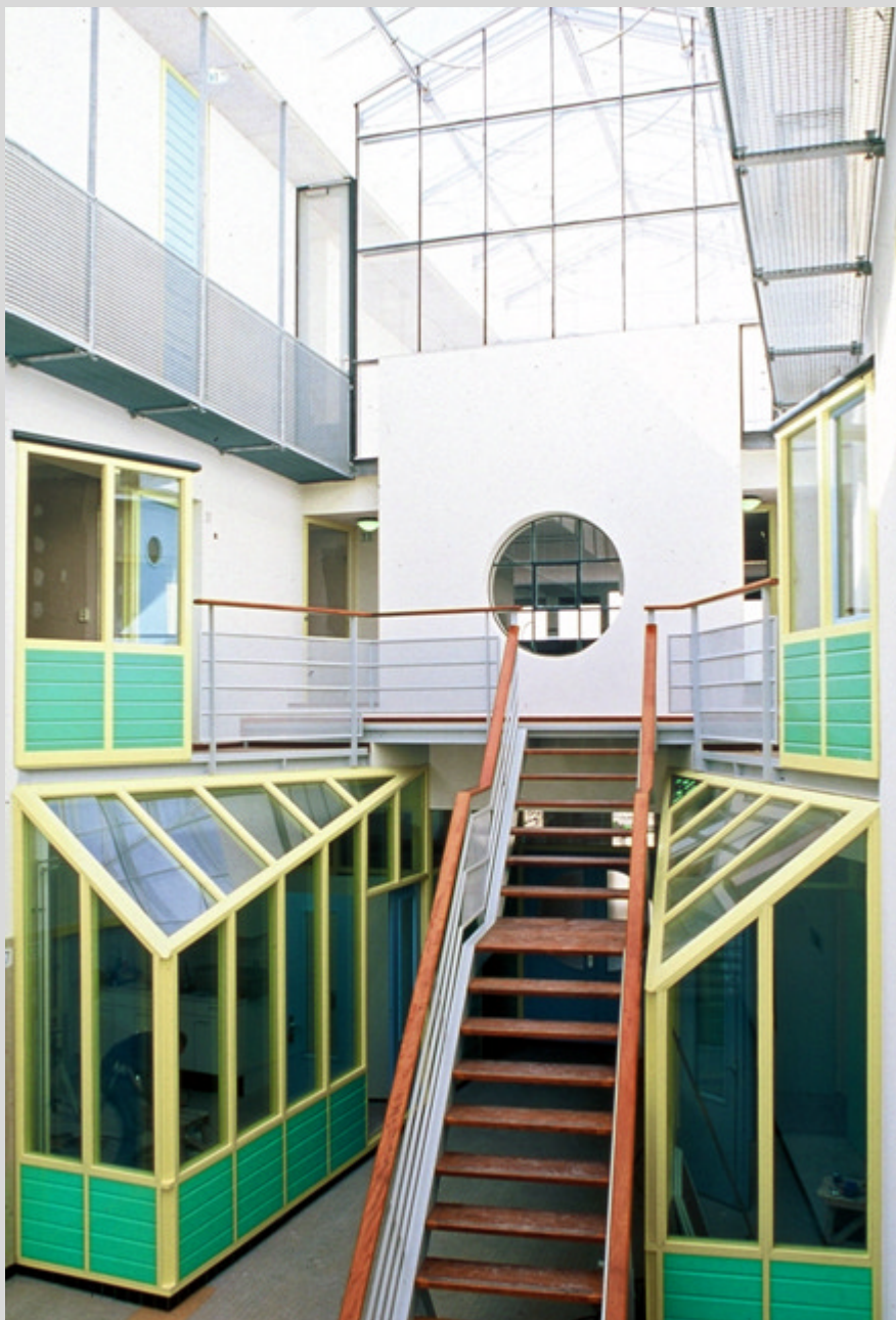
De woningen worden ontsloten vanuit de grote centrale hal, waar vroeger de havenarbeiders in de rij stonden om hun werkbriefjes in te leveren. Deze met een glaskap overdekte hal biedt nu mogelijkheden voor exposities.